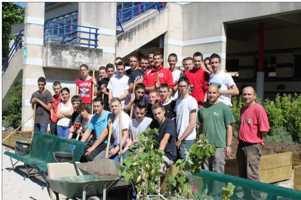
Pose photo en cours de chantier pour les 30 élèves du lycée horticole de Tournus qui ont travaillé sur le projet.