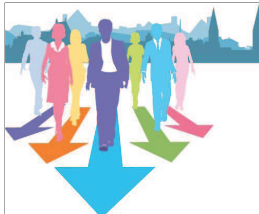
La participation à cette enquête permettra aux plus chanceux de gagner des lots.

Cette enquête destinée aux salariés est menée afin de