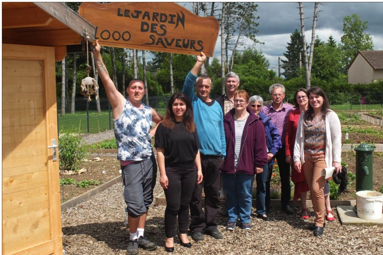
■ Une douzaine de stands seront installés afin de satisfaire le public. Ils iront de la technique du compostage à la vente de plantes, en passant par la dégustation et des informations données par des associations solidaires.

En matinée, il y aura une séance spéciale au cinéma la Palette. Plusieurs déambulations accompagnées de deux fanfares sont prévues en direction de jardins, comme le Verger conservatoire du lycée horti-